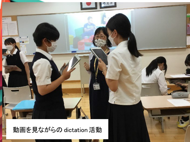
動画を見ながらの dictation 活動

Grace : Hi, Joel, listen, shall we meet up at Joe's café tonight? Joel : I can't, I've got guitar ... Grace : Sorry, ( )? Joel : Yeah, I've got guitar tonight. Grace : Sorry, I don't understand. Can ( ) ( ) ( ) ( )? Joel : I can't tonight. I've got guitar lessons. You know – guitar lessons ... I play in a band. Grace : Guitar, you can play guitar! Wow! ( ) ( ) do you have lessons? Joel : Twice a week. Grace : Sorry, ( ) ( ) ( ) ( )? Joel : Oh, Grace, what's the ( ) ( ) ( )? Twice a week – two times a week. On Tuesdays and Fridays. Grace : OK, OK, I ( ) ( )! I'm not stupid! You're just impossible to understand! Especially when you eat and talk at ( ) ( ) ( ) ... So when do you play with your band? Joel : Usually on Saturday afternoons. Is that OK? Grace : Yes, yes, OK. So what, are you like the new One Direction? Joel : One Direction! Come on! They're so ( ) ( )! More like, er ... Grace : Sorry? Can you ... I give up. You're impossible!